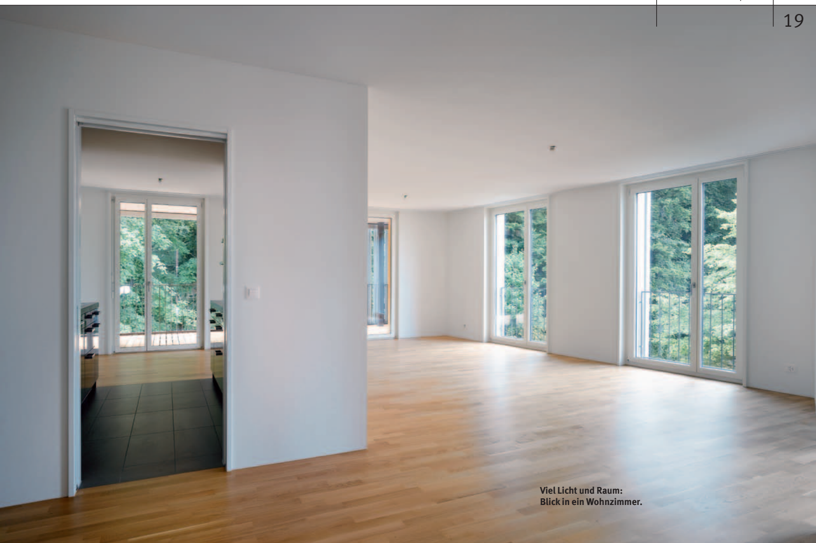
Viel Licht und Raum: Blick in ein Wohnzimmer.

kleiden die Fassaden. Verschiebbare Alu-Lamellenelemente vor den Fenstern bilden dazu einen Kontrast. Sie dienen als Sicht- und Sonnenschutz, sorgen aber auch für ein ständig wechselndes Fassadenbild – und blitzen wunderbar in der Sonne. Die Loggien sind mit Lärchenholz ausgekleidet, was ihnen viel Gemütlichkeit und Intimität verleiht. Kein Wunder, dass mancher Bewohner den privaten Aussenraum gar mit Bildern schmückt.