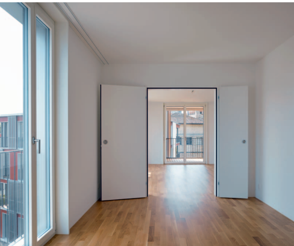
Dank einer Flügeltür kann das Wohnzimmer individuell vergrössert werden.

Auch das neuste Projekt im Kreis 4 stammt von diesem Büro (vgl. Kasten).