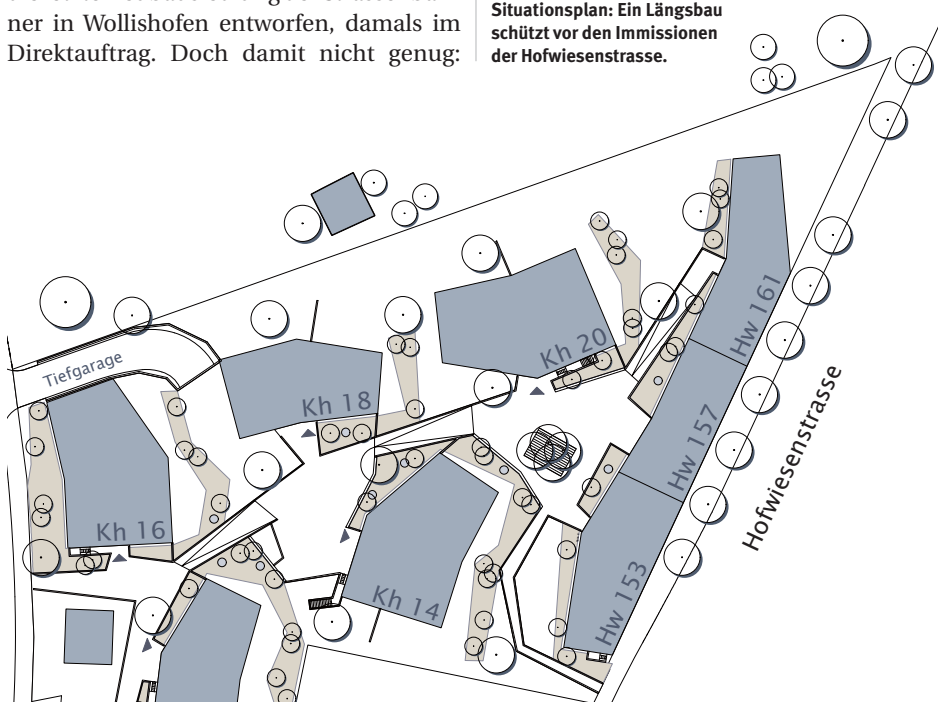
Situationsplan: Ein Längsbau schützt vor den Immissionen der Hofwiesenstrasse.

städtischen und kantonalen Fachleute naturgemäss ein gewichtiges Wort mit. Über die Qualitäten des Siegerprojekts war man sich jedoch einig. Und die Genossenschaft staunte nicht schlecht, als das Kuvert geöffnet wurde. Die Gewinner, Althammer Hochuli Architekten, hatten nämlich schon die letzte Neubausiedlung der Strassenbahner in Wollishofen entworfen, damals im Direktauftrag. Doch damit nicht genug: